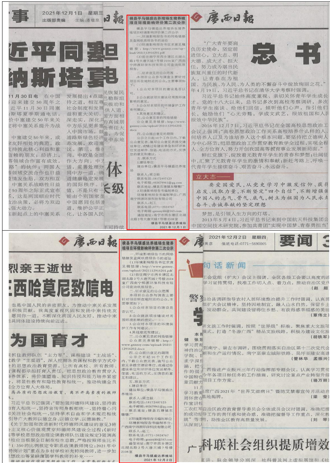
图3 12月1日、12月2日报纸公示图片

2021年12月1日和12月2日在广西日报社进行了2次登报公示，《广西日报》为广西主流的报社，属于建设项目所在地公众易于接触的报纸，符合《环境影响评价公众参与办法》的要求。