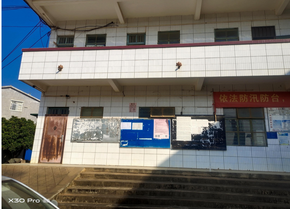
良圻农场四分场公告张贴点 图4 二次公示现场张贴照片