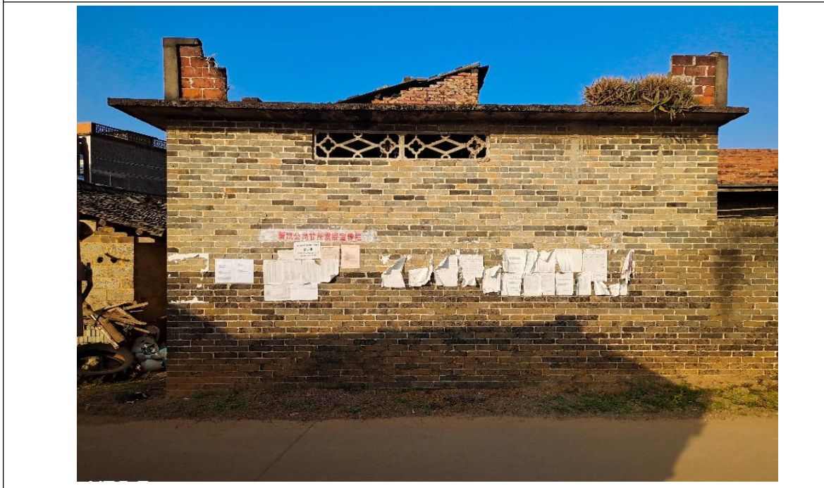
良造村公告张贴点