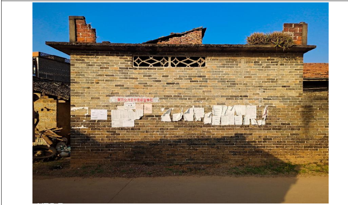
良造村公告张贴点