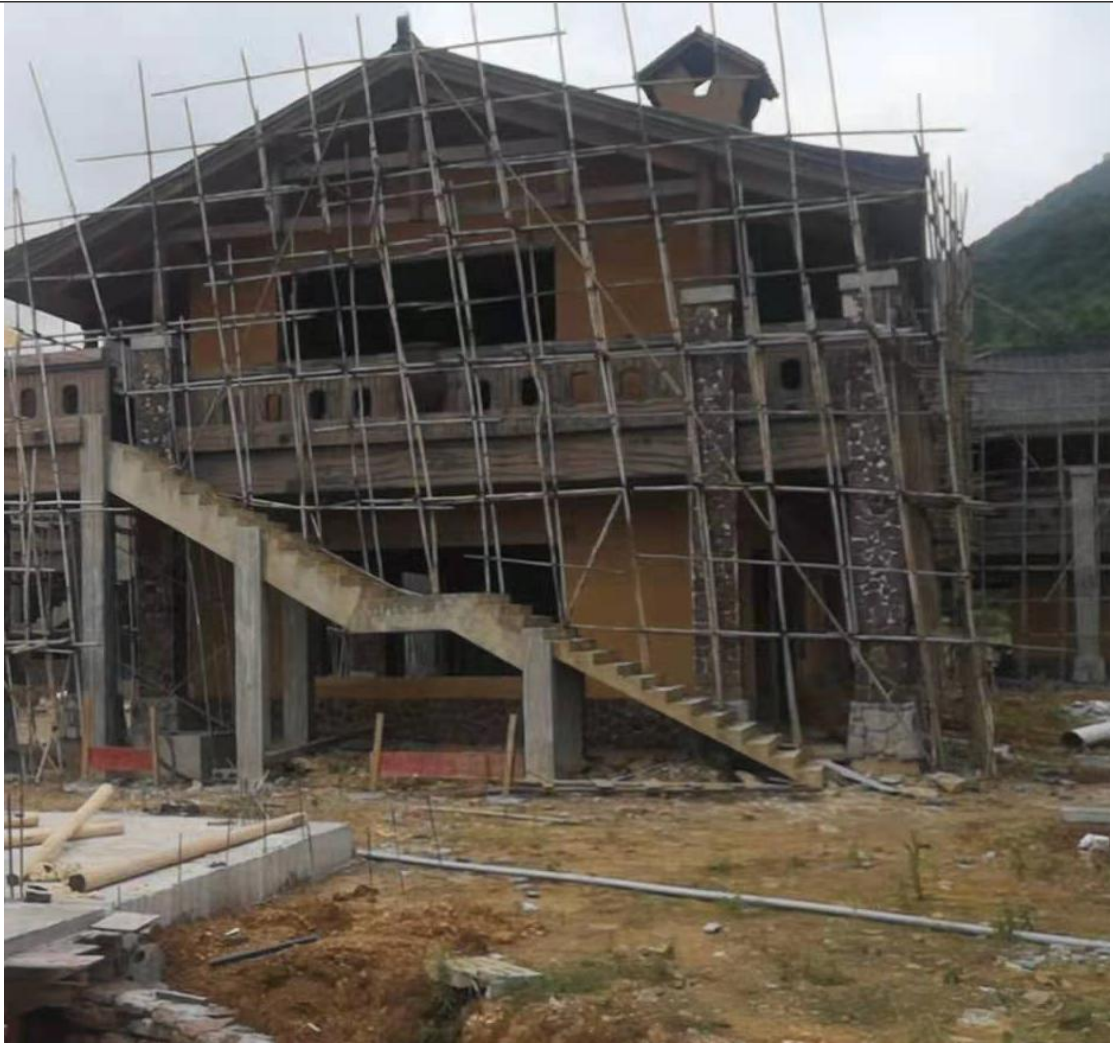
主体工程施工现状（一）