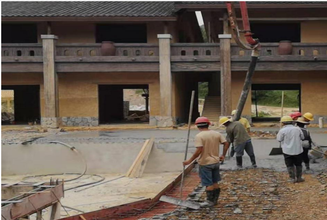
主体工程施工现状（四）