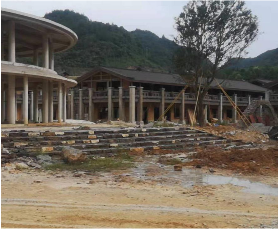
主体工程施工现状（三）