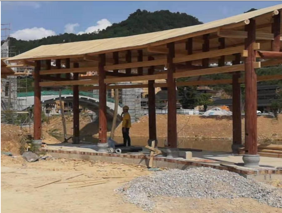
主体工程施工现状（六）