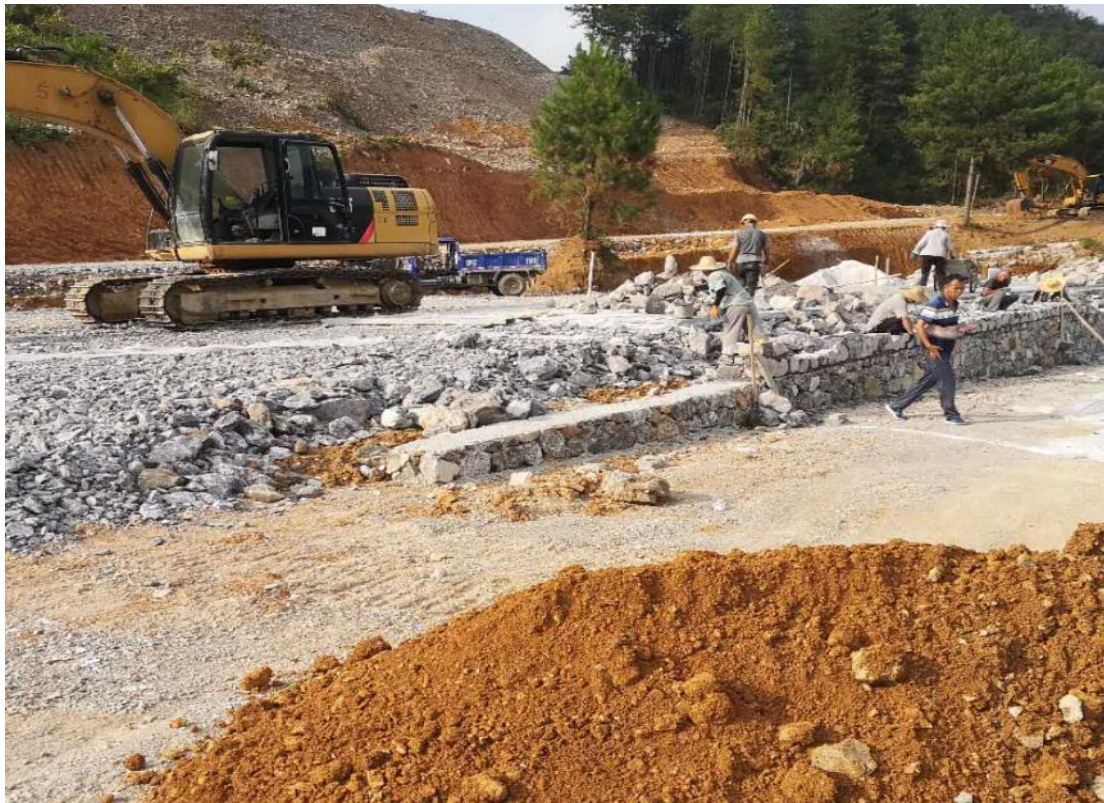
主体工程施工现状（五）