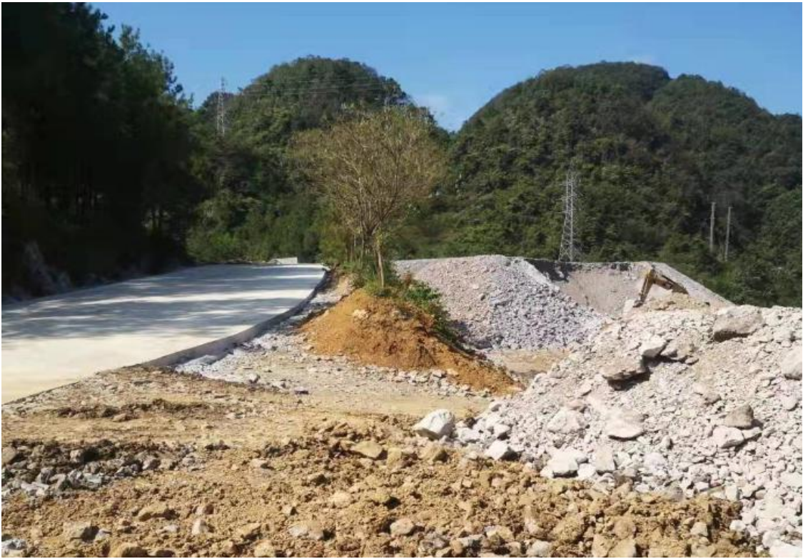
主体工程施工现状（一）