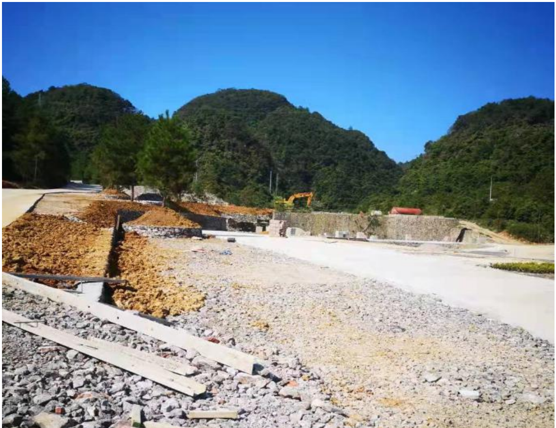
主体工程施工现状（二）