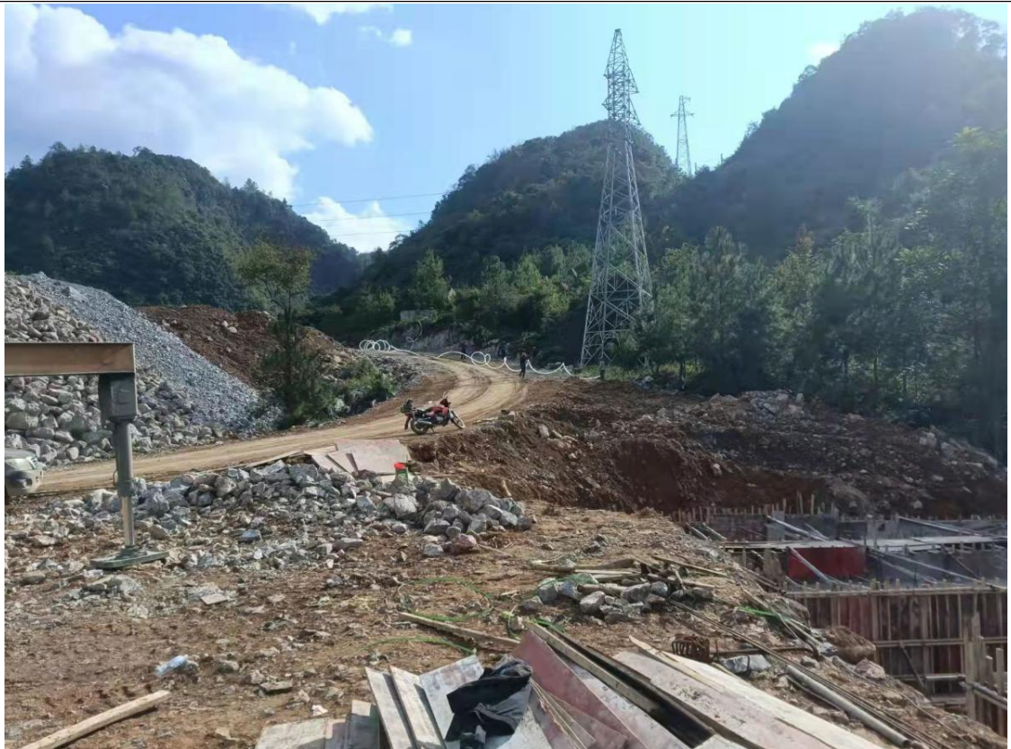
道路连接区施工现状