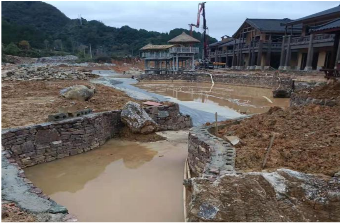
主体工程施工现状（三）