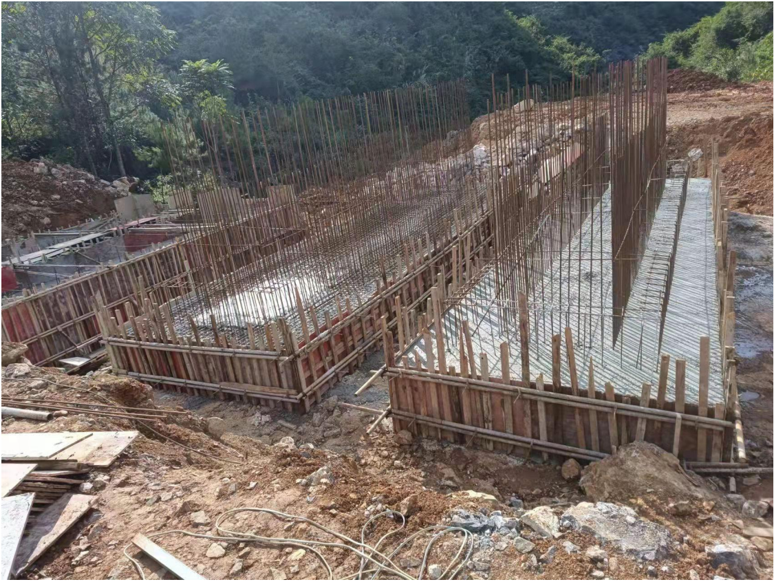
主体工程施工现状（五）